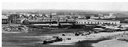
Mar del Plata en 1895.

Más tarde, en 1879 y también a iniciativa de su fundador, se estableció el Partido de General Pueyrredón dividiendo en dos el Partido de General Balcarce.